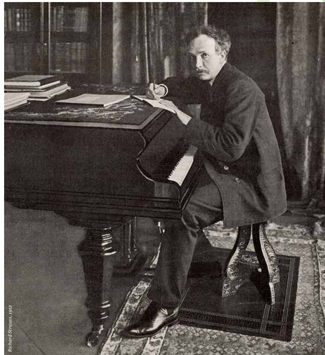
Richard Strauss, 1912

Heldigvis kom samarbejdet med Hofmannsthal i gang igen med operaerne Die ägyptische Helena og Arabella – og naturligvis som altid med sopranstemmen helt i front.